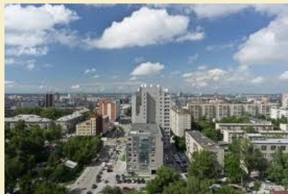
Перспектива современной улицы семьи Шамшиных