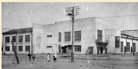
Жиркомбинат на улице семьи Шамшиных, 1960-ые годы