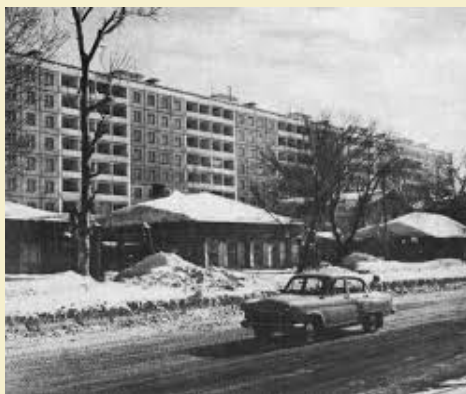
Улица семьи Шамшиных 1970-ые годы